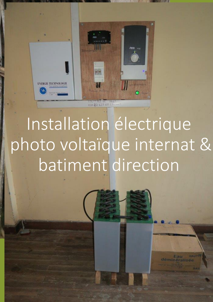
Installation électrique photo voltaïque internat & batiment direction