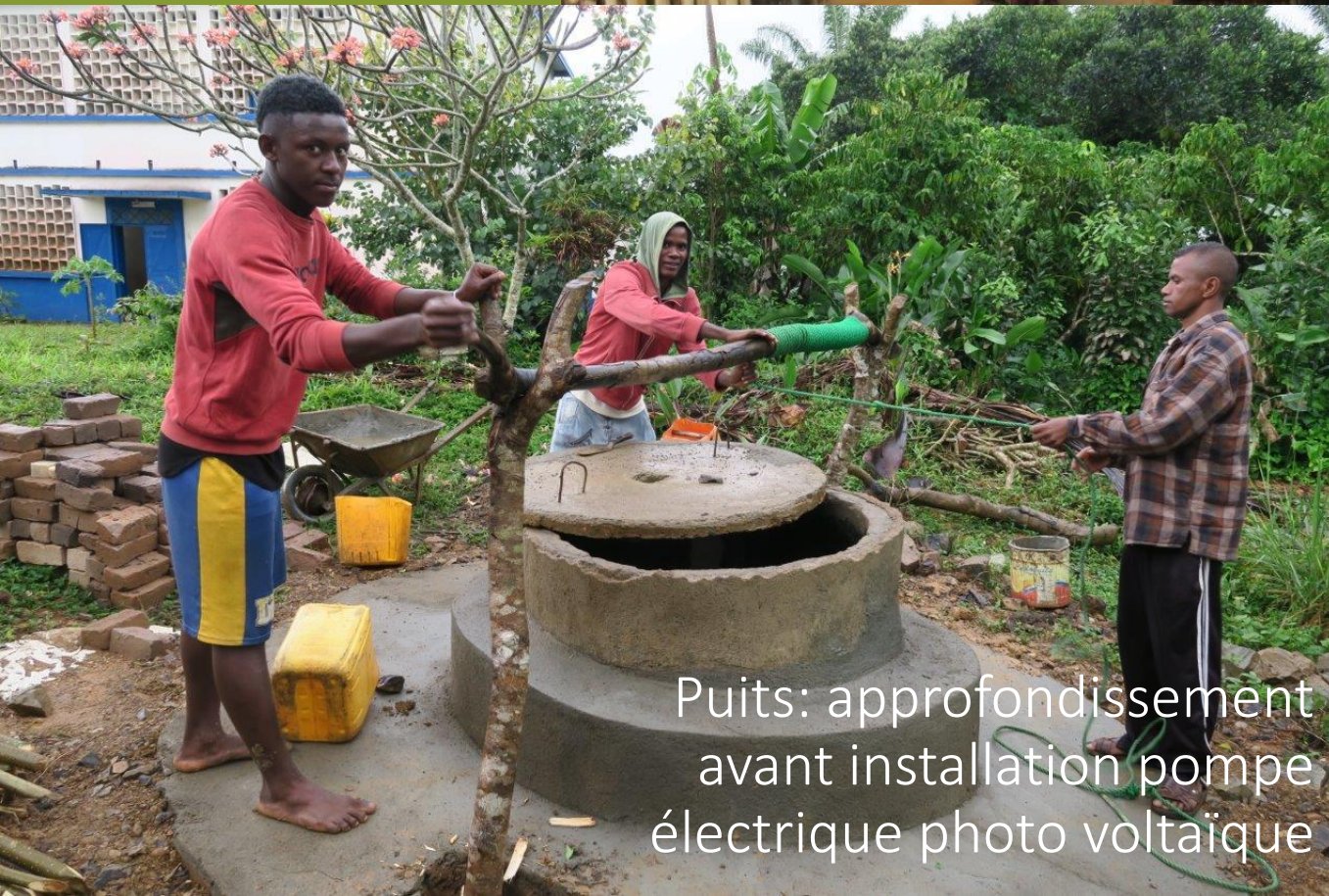
Puits: approfondissement avant installation pompe électrique photo voltaïque